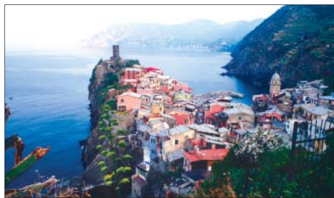
Die Dörfer der Cinque Terre werden am besten zu Fuß erobert.