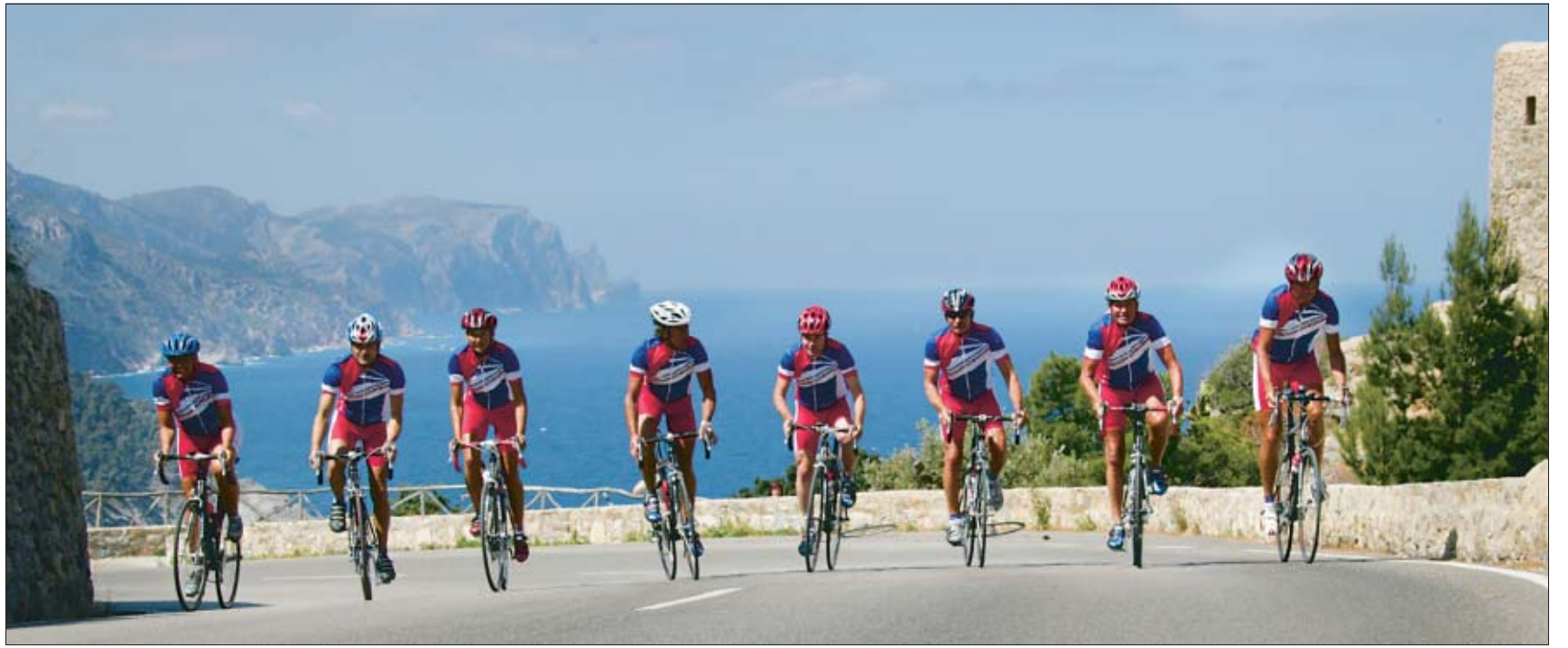
Traumhafte Routen bieten sich Radtouristen auf Mallorca. Anfänger kommen ebenso auf ihre Kosten wie Fortgeschrittene.